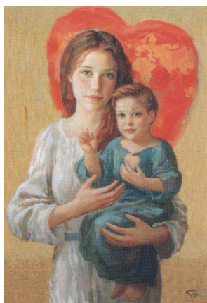
NOSTRA SIGNORA DEL S. CUORE DI GESÙ

Ieri, in tutta Italia, si è celebrata la Festa di Nostra Signora del Sacro Cuore; nel resto del mondo si celebra invece l'ultimo sabato del mese di maggio.